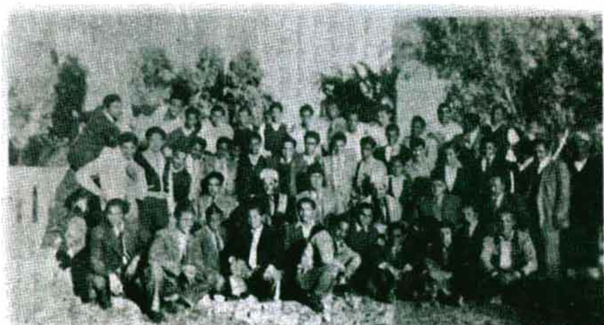
البعثة التعليمية اليمنية في القاهرة من كتاب عبدالله جزيلان : الطريق إلى الهدف / بيروت ١٩٨٨