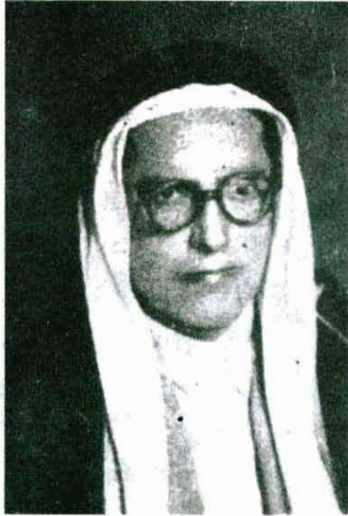
عبدالله القصيمي