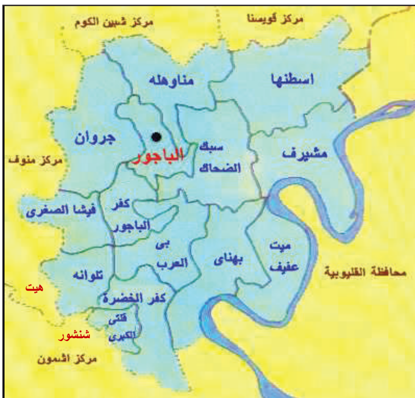
خريطة مركز الباجور وموقع قرية تلوانة