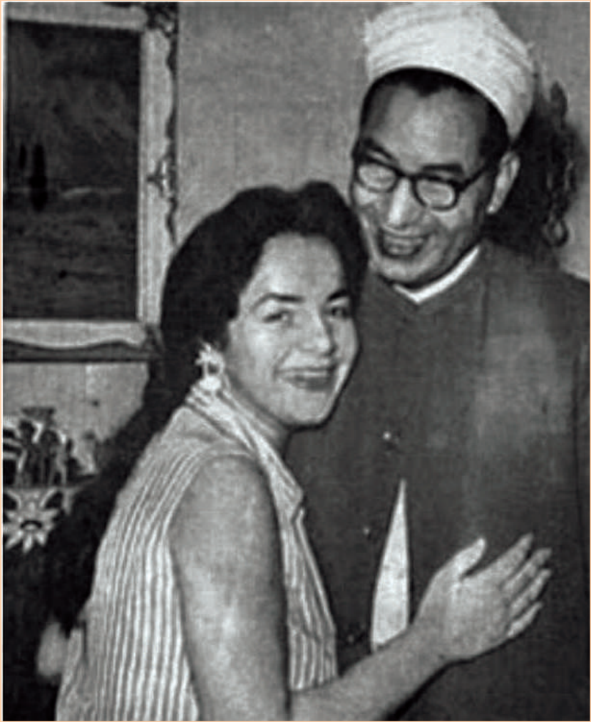
فضيلة الشيخ الباقوري مع كبرى كريماته