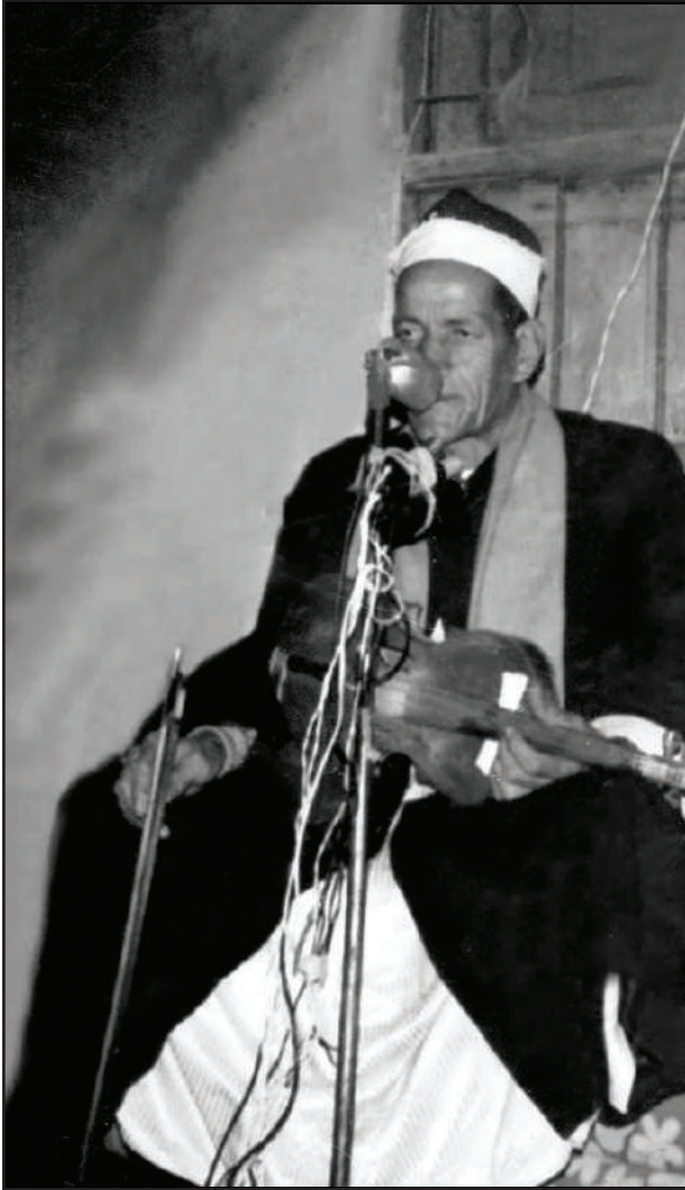
الشاعر فتحي سليمان