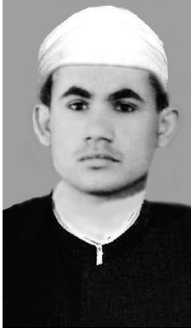
الفقيه إمام ابراهيم بكر في زيه الأزهرى

منوف، وهو أحد ضباط الجيش المصرى فى عهد الخديو إسماعيل.