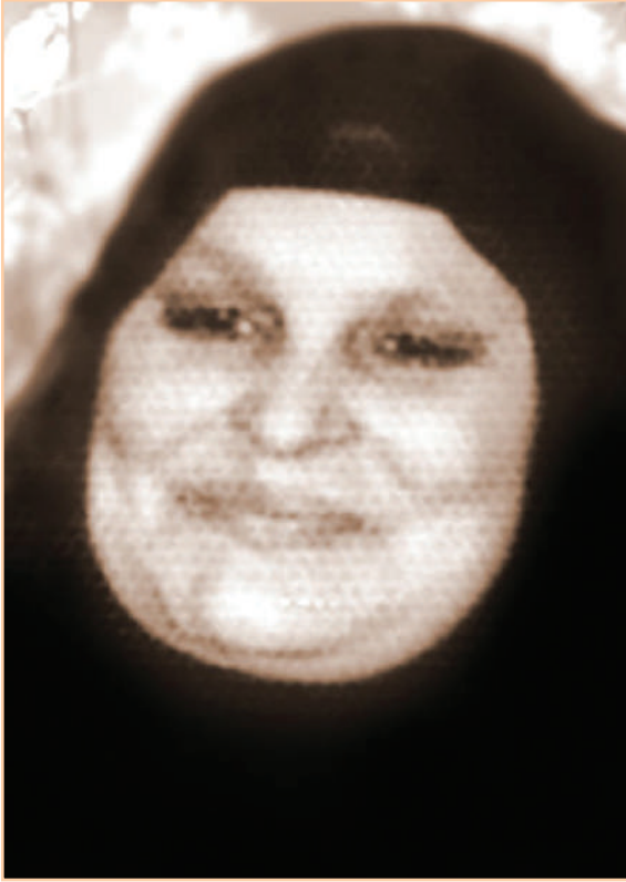
آخر صورة التقطت للسيدة والدتي (يرحمها الله) قبل وفاتها