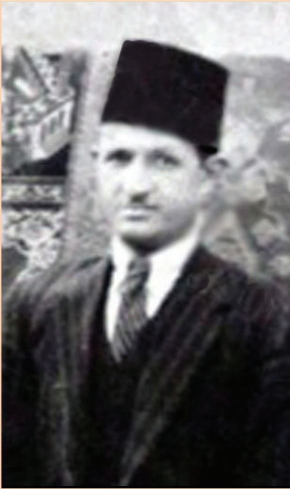
آخر صورة التقطت للسيد الوالد (يرحمه الله) قبيل وفاته