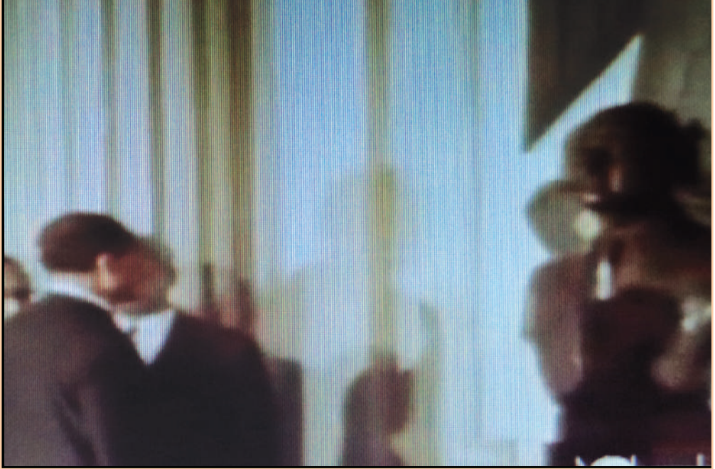
الرئيس السادات ينحني أمام «صنم عيدالناصر» قبل حلف اليمين الدستوري لرئاسة الجمهورية